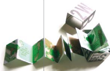
Ta chambre (Bülb Comix, Genève)