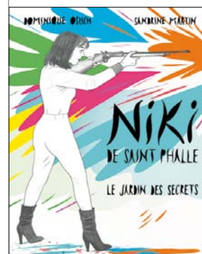
Niki de Saint Phalle (Casterman)