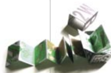
Ta chambre (Bülb Comix, Genève)