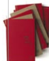
Ma sœur et moi (Éditions un-état-d'esprit)