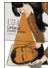
L'Œil lumineux (Actes Sud/l'An 2)