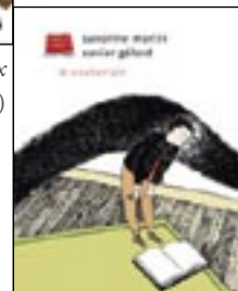
Le Souterrain (L'An 2)